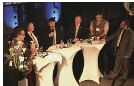
Een levendige paneldiscussie tijdens de Deutscher Lackierertag.

Tegelijk vond een beurs plaats in het Standex Center. Bouwers van werkplaatsen, leveranciers en dienstverleners uit de sector stelden er hun aanbod voor. Standex nodigde zijn gasten ook nog uit naar het Wuppertaler Brauhaus, een ongebruikelijke locatie - met voormalige openbare baden uit de laat 19e eeuw, die is omgebouwd tot een evenementenlocatie.