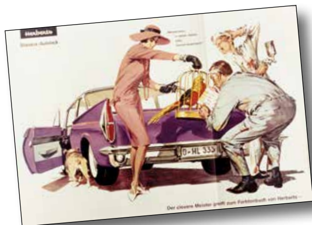
De Standox advertenties uit de jaren 1950 en 1960 bleven jarenlang in de werkplaats hangen.