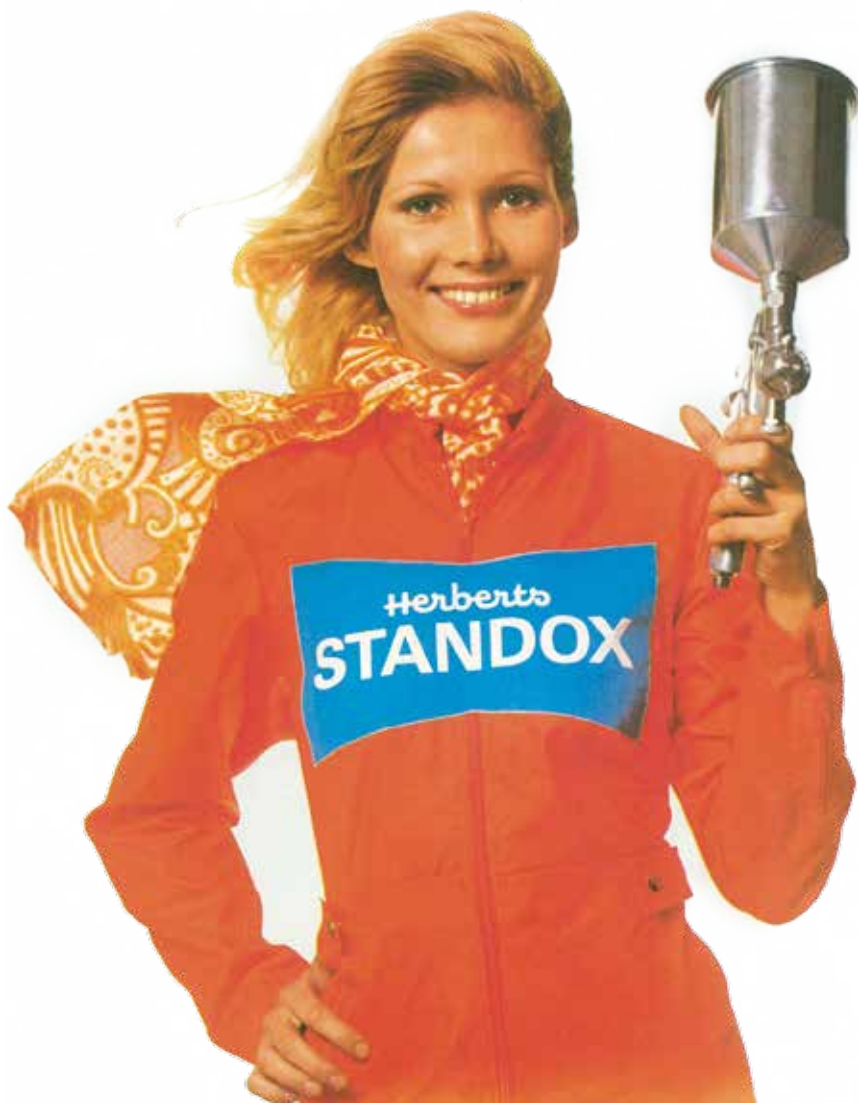
Het gezicht van de Standox-reclame einde jaren 60: Standoxy glimlachte niet alleen op de affiches maar dook soms zelfs op tijdens events.

De schadeherstelbedrijven kregen posters die informatie verstrekken over de Standox producten aan de ene kant, maar ook leuke illustraties brachten van alledaagse situaties in de werkplaats. Een voorbeeld? Het schadeherstelbedrijf krijgt het bezoek van een zeer modebewuste dame die haar auto wil laten overspuiten in de nieuwe seizoenskleur 'fazantenog geel'. Als staal heeft ze een levende fazant bij zich. De manager verwijst haar enkel naar het Standox kleurenboek. De humoristische en liefdevol getekende beelden, die mooi de tijdsgeschiedenis vatten, sloegen goed aan. In sommige bedrijven bleven de affiches jarenlang hangen.