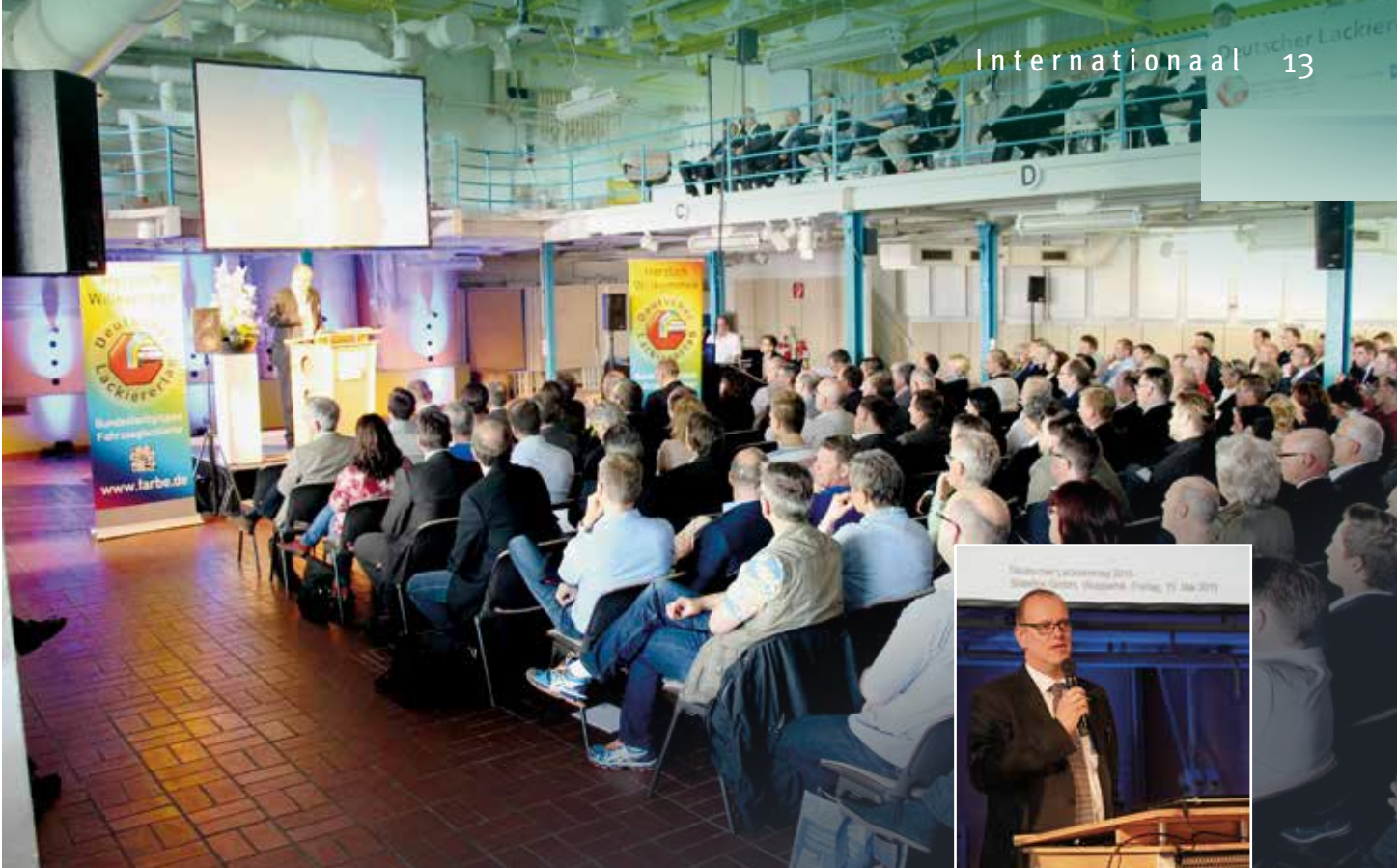
Dit jaar was de regie van de 'Lackierertag' in handen van Standex in Wuppertal.